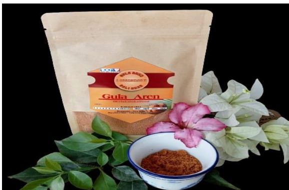
Gambar 5. Produk Gula Semut Aren

Produk hasil pelatihan merupakan hasil olahan gula aren yakni gula semut aren, sekaligus melakukan pelatihan mendesain kemasan dan melakukan proses pengemasan. Upaya pelatihan ini bertujuan untuk meningkatkan nilai jual dan daya saing produk dipasaran, sehingga produk gula semut aren dapat dipasarkan di pasar yang lebih luas yakni pasar online maupun memperluas pasar. Produk akan menjadi unggulan desa yang akan meningkatkan pendapatan para pengolah gula aren dan berkomitmen untuk mengembangkan potensi lokal Desa dan kawasan perdesaan.