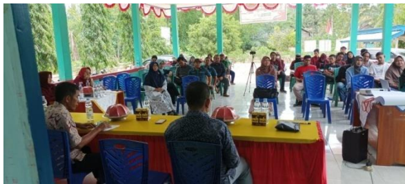
Gambar 2. Tahap Observasi dan FGD

Tujuan utama dari pelaksanaan FGD adalah untuk mengumpulkan data kualitatif tentang pengalaman, pandangan, dan persepsi kelompok dalam topik sistem produksi gula aren dan pemasaran. Data ini kemudian dapat digunakan untuk menganalisis masalah, kebutuhan, harapan, atau sikap kelompok tersebut terhadap topik yang dibahas. Selain itu, kegiatan FGD juga dapat membantu memahami bagaimana kelompok tersebut memandang topik yang dibahas dalam konteks sosial dan budaya yang lebih luas.