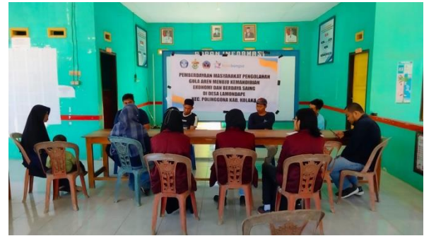
Gambar 3. Tahap Persiapan Pelaksanaan Pelatihan

Tahap persiapan kegiatan pelatihan Tim pelaksana melakukan koordinasi dengan mitra yakni kelompok pengolah gula aren untuk membentuk kepanitiaan sekaligus menetapkan tempat kegiatan. Mengkoordinir mahasiswa yang mengikuti program kosabangsa untuk mempersiapkan administrasi dan persiapan sarana prasarana pada saat pelatihan.