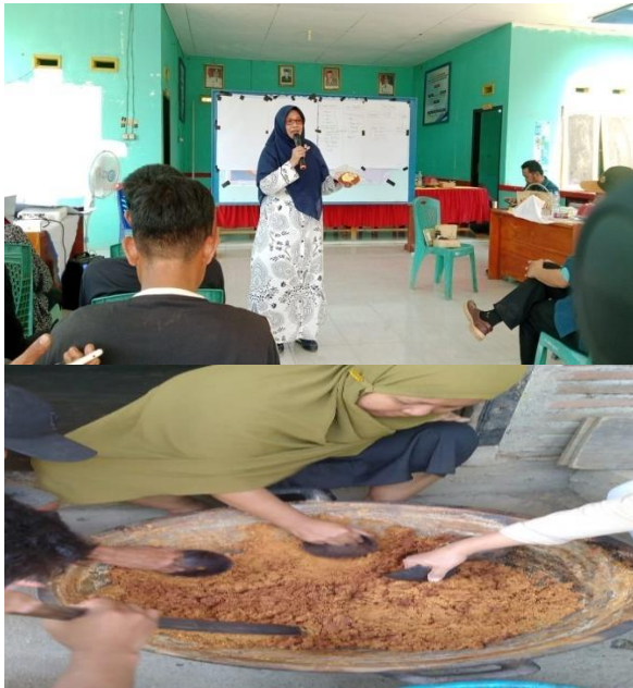
Gambar 4. Tahap Pelaksanaan Pelatihan

Produk hasil pelatihan merupakan hasil olahan gula aren yakni gula semut aren, sekaligus melakukan pelatihan mendesain kemasan dan melakukan proses pengemasan. Upaya pelatihan ini bertujuan untuk meningkatkan nilai jual dan daya saing produk dipasaran, sehingga produk gula semut aren dapat dipasarkan di pasar yang lebih luas yakni pasar online maupun memperluas pasar. Produk akan menjadi unggulan desa yang akan meningkatkan pendapatan para pengolah gula aren dan berkomitmen untuk mengembangkan potensi lokal Desa dan kawasan perdesaan.