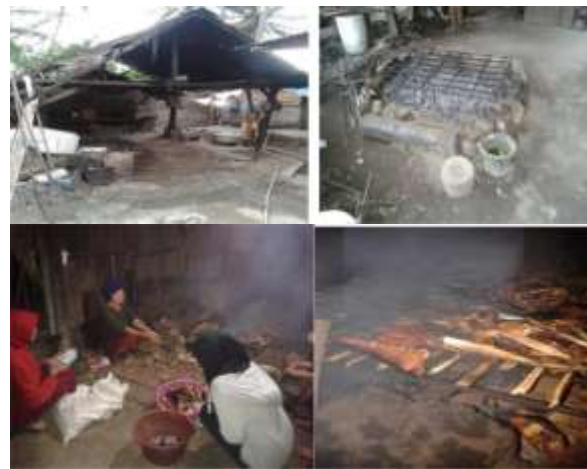
Gambar 1. Kondisi dan Situasi pada saat proses pengolahan ikan tapa oleh kelompok Di Kelurahan Tipo.

Menurut Ketua Kelompok bahwa ikan yang dihasilkan di Kelurahan Tipo cukup melimpah, ikan tersebut dalam jumlah banyak di jual ke pengepul dengan harga Rp.65.000,-/kg mentah. Namun ada juga yang jual dalam skala plastik kecil berkisar Rp. 15.000 per potong. Kedua ikan ini bahkan dijual dalam bentuk makanan siap saji.