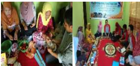
Gambar 5. Pelatihan Non Teknis dan Pengemasan Produk Ikan Tapa

Partisipasi yang tinggi dari pihak mitra memberikan dampak positif sehingga terlaksananya kegiatan pengabdian pada masyarakat diantaranya pengolahan Kegiatan berjalan lancar diikuti lebih dari 10 peserta yang memiliki motivasi memajukan kelompok. Hasil pelatihan menunjukkan peserta memiliki pengetahuan dan ketrampilan mengolah produk ikan tapa berbasis drum vertikal, juga telah mampu memproduksi dan mengemas serta memahami prosedur cara produksi pangan yang baik (CPPB) mulai dari pemilihan bahan, proses produksi, pengemasan dan pelabelan termasuk cara memperoleh ijin depkes no P-IRT.