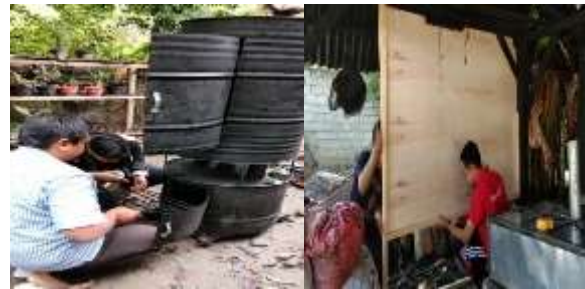
Gambar 3. Persiapan dan Renovasi Rumah Tapa

tukang bangunan, dan belanja material bangunan.