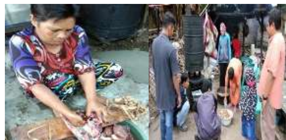
Gambar 4. Uji Coba Alat Pengasapan Sistem Drum Vertikal

Setelah renovasi selesai dan di dalamnya terpasang alat pengasap kemudian dilakukan uji coba pengasapan. Terlebih dahulu ditentukan jenis ikan yang akan diasap. Jenis ikan dipilih yang memiliki nilai jual juga tinggi dan disukai konsumen dengan kondisi yang masih segar. Ikan disiangi, dibersihkan dan diberi tusukan lidi guna pada saat pengasapan ikan tidak hancur dan rapuh. Selanjutnya ikan ditiriskan sebelum diasap. Setelah cukup tiris kemudian ikan diletakkan pada besi-besi sejajar di dalam drum vertikal. Tongkol jagung kering dan basah dimasukkan ke dalam wadah arang, dinyalakan hingga keluar asap dan ditaruh di dalam tungku asap. Setelah sekitar 1-2 jam tutup tungku asap dibuka dan ikan asap dikeluarkan.