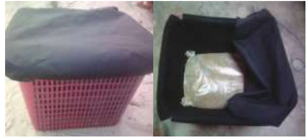
Gambar 2. Teknologi Tempat Penampung Limbah Ikan Di Pasar dan Rumah Makan

Pengadaan bahan baku limbah pengolahan hasil perikanan dalam kegiatan ini diperoleh dari pedagang ikan di Pasar masomba, Pasar Inpres dan pasar Tua, yaitu dibeli dengan harga Rp. 500,- per Kg sampai ke lokasi pengolahan. Potensi limbah yang dihasilkan dari pedagang pasar ini mencapai 1 ton per hari. Untuk meningkatkan kapasitas produksi, dapat dilakukan dengan mengumpulkannya dari warung makan dan rumah tangga di wilayah Sekitar. Jadi dengan adanya kerja sama dengan pedagang ikan di ke 3 Pasar ini dan pasar-pasar lainnya, ketersediaan bahan baku tidak menjadi persoalan lagi.