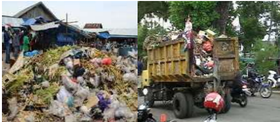
Gambar 1. Kondisi Pasar dan Armada Pengangkut Sampah di Kota Palu

Usaha pemanfaatan limbah hasil pengolahan perikanan menjadi produk bernilai ekonomis ini akan dilakukan di kelompok mitra ternak lele, sehingga dapat menghemat pengeluaran investasi awal karena tidak perlu menyewa tempat. Jadi secara prinsip, lokasi cukup mendukung untuk kegiatan usaha pemanfaatan limbah pengolahan hasil perikanan menjadi produk tepung ikan dengan nilai ekonomis lebih tinggi.