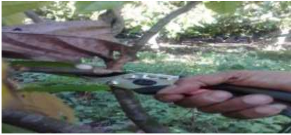
Gambar 4. Pemotongan ranting yang terserang VSD