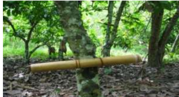
Gambar 2. Pengendalian PBK dengan menggunakan semut predator

Untuk melakukan pengendalian hama PBK dengan predator Dolichoderus sp, diawali dengan pengembangan predator Dolichoderus sp melalui pembuatan sarang buatan agar dapat berkembang dengan baik. Sarang buatan yang akan digunakan adalah jenis sarang yang terbuat dari batang bambu dan daun kelapa. Setelah diperagakan teknik membuat sarang buatan tersebut selanjutnya dilakukan demonstrasi pembuatan sarang buatan untuk Dolichoderus sp. dan teknik pemasangan sarang buatan tersebut pada pertan aman buah kakao yang efektif (Gambar 2), baik dalam usaha meningkatkan jumlah populasi Dolichoderus sp tersebut maupun meningkatkan predasinya terhadap hama PBK.