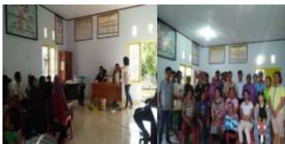
Gambar 17. Pendampingan kelompok tani mitra dalam pembuatan pupuk cair (MOL) berbahan baku limbah rumah tangga

5. Pendampingan Kelompok Tani Mitra dalam Pengembangan Pupuk Cair MOL di Desa Sarumana Kec. Palolo Kab. Sigi, yang telah dilaksanakan pada tanggal 31 Juli 2019 sampai dengan 02 Agustus 2019, dengan jumlah peserta 25 orang yang dihadiri oleh masing-masing kelompok tani mitra. Pendamping ini dilaksanakan dengan tujuan untuk meningkatkan keterampilan dan pengetahuan kelompok tani mitra dan masyarakat dalam pemanfaatan limbah rumah tangga untuk menjadi pupuk organik cair MOL (Gambar 17).