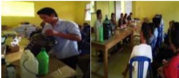
Gambar 10. Cara pembuatan jamur Trichoderma sp. cair