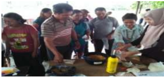
Gambar 9. Cara perbanyakan jamur antagonis dengan menggunakan media jagung