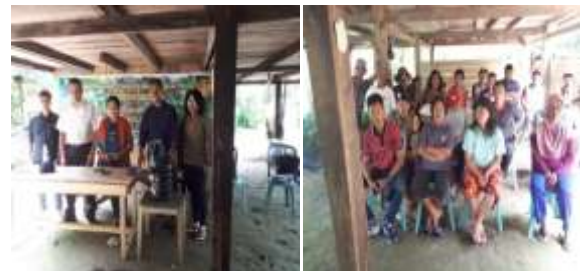
Gambar 5. Kegiatan Sosialisasi Program Pengembangan Desa Mitra di Desa Sarumana Kec. Palolo Kab. Sigi

Tim pengabdian telah melaksanakan Sosialisasi Program Pengembangan Desa Mitra (PPDM), pada tanggal 06-07 April 2019 di kantor Desa Sarumana. Hal ini bertujuan untuk mengembangkan Desa Sarumana sebagai pusat kakao rakyat. Jumlah peserta sosialisasi sebanyak 25 orang, yang terdiri dari masyarakat, anggota kelompok tani mitra, kepala desa, dan penyuluh pertanian lapangan (Gambar 5).