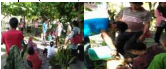
Gambar 8. Jamur antagonis ke tanaman kakao di Desa Sarumana

Selain penyakit VSD, penyakit busuk buah dapat menyebabkan penurunan hasil produksi. Hal ini disebabkan karena kurangnya perawatan atau sanitasi yang dilakukan oleh petani kakao di Desa Sarumana Kec. Palolo Kab. Sigi. Maka dari itu, dengan adanya kegiatan PPDM di desa Sarumana masyarakat khususnya kelompok tani mitra dapat mengetahui cara atau teknik pengendalian penyakit yang ramah lingkungan, yaitu dengan cara sanitasi dan pemanfaatan jamur antagonis Trichoderma sp. dan B. bassiana . Maka dari itu dilakukan kegiatan pelatihan Sistem Budidaya dan Pengendalian OPT Tanaman Kakao di Desa Sarumana Kec. Palolo Kab. Sigi pada tanggal 30 April 2019 sampai dengan 02 Mei 2019, dengan tujuan untuk mendampingi kelompok tani mitra dalam cara pengaplikasian cendawan Trichoderma sp. pada tanaman kakao sebagai agensi hayati pengendalian busuk buah kakao di tempat yang telah disiapkan (Gambar 8).