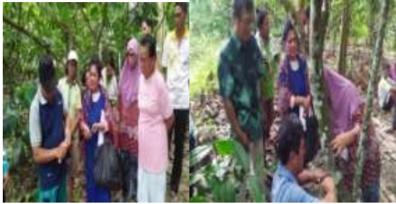
Gambar 12. Cara side grafting di Desa Sarumana Kec. Palolo

bagi batang sambungan yang sedang tumbuh (Direktorat Jenderal Perkebunan Kementerian Pertanian, 2014).