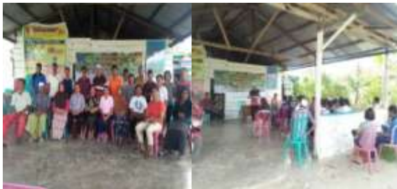
Gambar 6. Kegiatan penyuluhan pengembangan kakao rakyat untuk meningkatkan produksi di Desa Sarumana Kec. Palolo Kab. Sigi

penyuluhan pertanian lapangan (PPL) (Gambar 6).