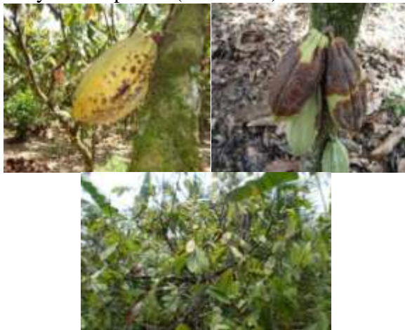
Gambar 1. a. Buah kakao terserang PBK, b. Buah kakao terserang busuk buah, c. Tanaman kakao yang terserang VSD

kayu atau Vascular Streak Dieback(VSD),(5) kurang perawatan oleh petani, (6) Sarana produksi seperti pupuk dan pestisida semakin mahal dan pada waktu-waktu tertentu seringkali tidak tersedia di pasaran menyebabkan petani tidak melakukan pemupukan dan pengendalian hama-penyakit (tidak dilakukan perawatan tanaman), (7) Ketergantungan petani pada pupuk kimia dan pestisida kimia sangat tinggi sehingga biaya usaha tani semakin mahal, (8) adanya limbah kulit buah kakao yang dapat menjadi sumber penularan berbagai macam penyakit, dan (9) rendahnya mutu biji kakao rakyat yang berakibat pada rendahnya nilai jual yang diterima oleh masyarakat /petani (Gambar 1).