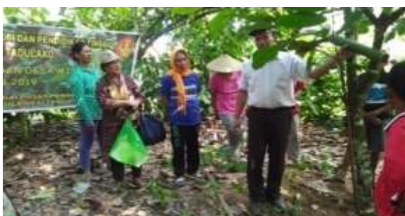
Gambar 13. Pendamping kelompok tani mitra dalam pemasangan sarang buatan semut Dolichoderus sp.