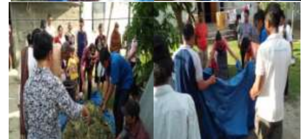
Gambar 11. Cara pembuatan pupuk kompos berbahan baku limbah kulit buah kakao