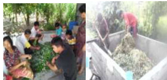
Gambar 14. Pendampingan kelompok tani mitra dalam pembuatan pupuk berbahan baku kulit kakao