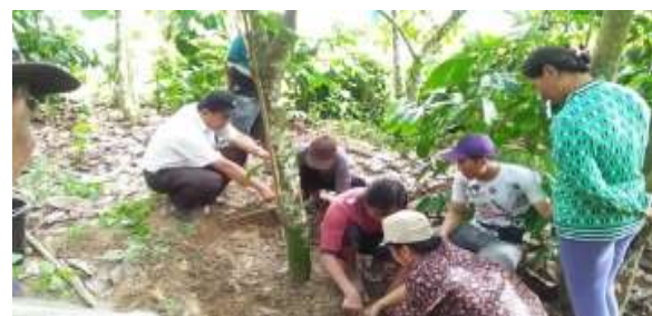
Gambar 15. Pendampingan kelompok tani mitra dalam pengaplikasian Trichoderma sp. dengan infus akar