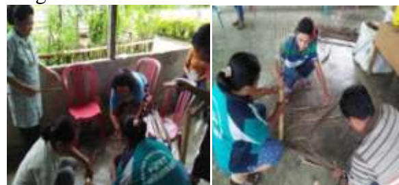
Gambar 7. Pembuatan sarang semut Dolichoderus thoracicus dari batang bambu dan daun kelapa

predator Dolichoderus sp, diawali dengan pengembangan predator Dolichoderus sp. melalui pembuatan sarang buatan dengan tujuan agar semut tersebut dapat berkembang dengan baik