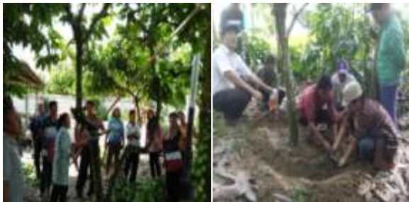
Gambar 16. Pendamping kelompok tani mitra dalam pengendalian penyakit VSD

pemangkasan dan infus akar cendawan antagonis Trichoderma cair pada tanaman kakao di tempat yang telah disiapkan (Gambar 16)